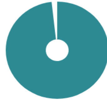
Type of Report